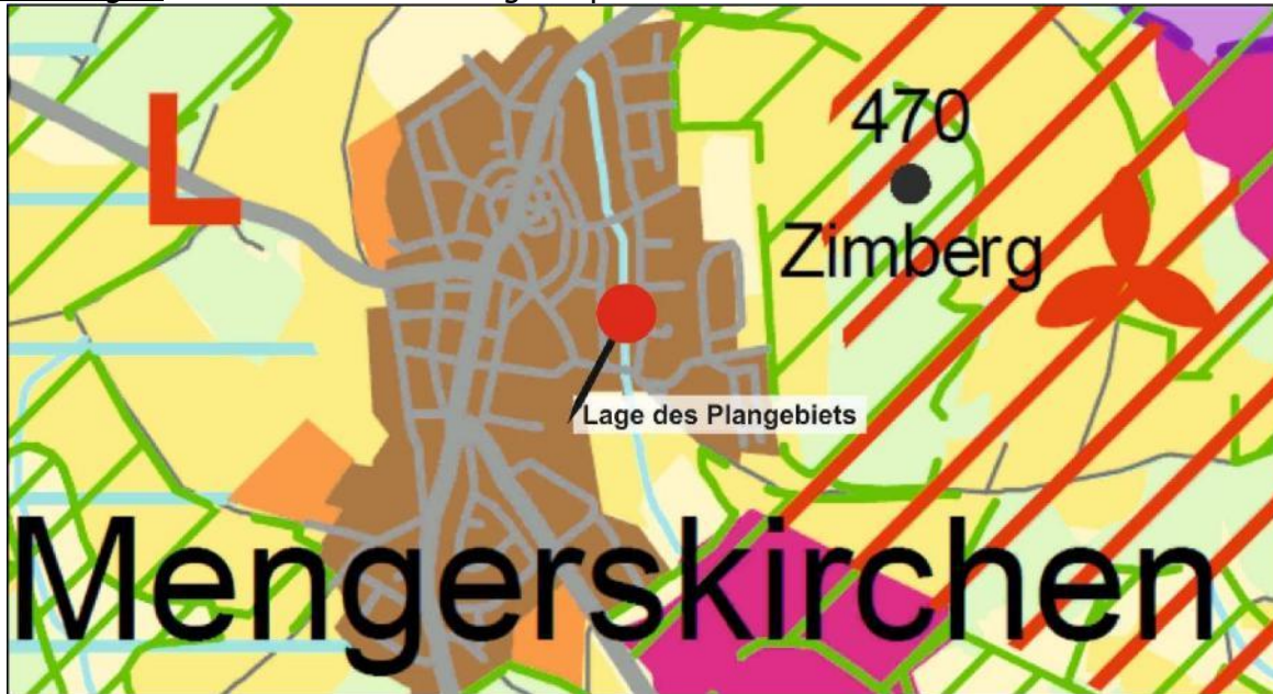
Abbildung 2: Ausschnitt aus dem Regionalplan Mittelhessen 2010

Der vorhandene Lebensmittelmarkt wurde auf der Grundlage des Bebauungsplans „Lämmertgärten, 5. Änderung“ zugelassen. Der Bebauungsplan lässt in dem festgesetzten Sondergebiet für großflächigen Lebensmitteleinzelhandel eine Verkaufsfläche von 800 qm für einen Lebensmittelmarkt sowie einen Backshop/Café von 200 qm zu. Randsortimente dürfen auf 10 % der der zulässigen Verkaufsfläche angeboten werden. Die Planung sieht eine Erweiterung der Verkaufsfläche des Lebensmittelmarktes auf 1.200 qm vor.