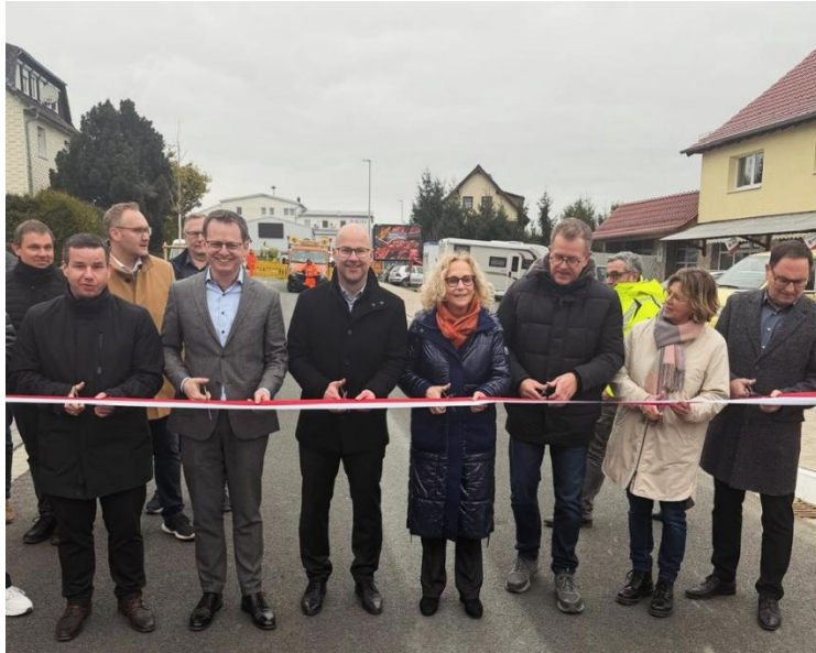
Freigabe der Ortsdurchfahrt Mengerskirchen Mitte März