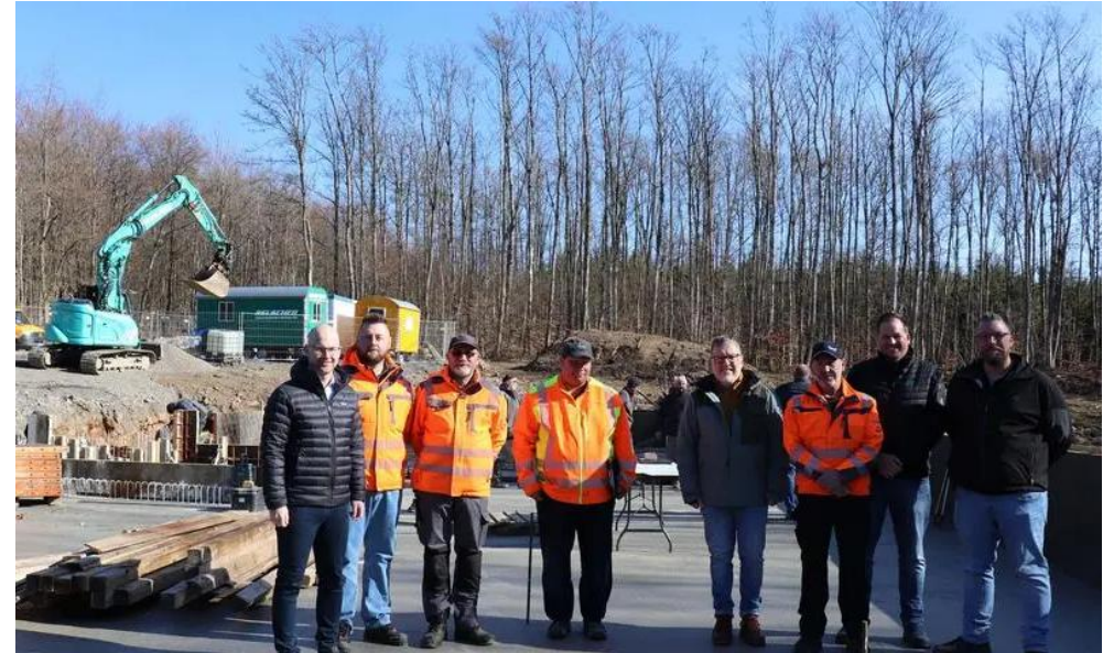
Arbeiten am Hochbehälter laufen auf Hochtouren