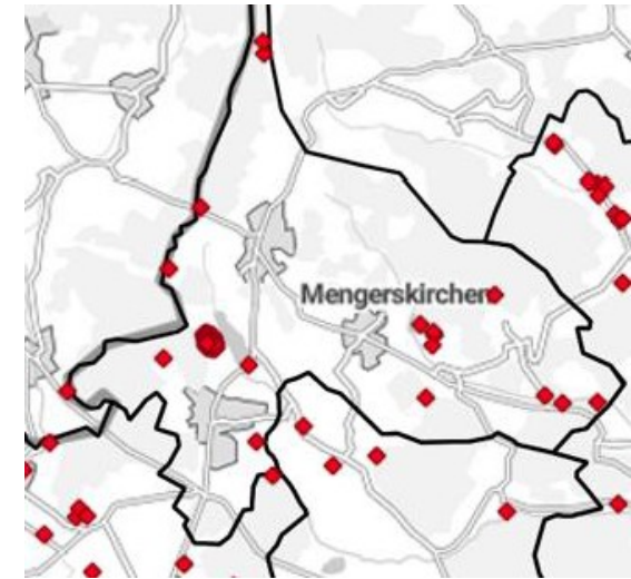
Sog. „graue Flecken in Mengerskirchen