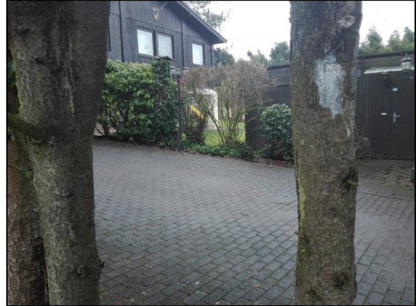
Abb. 2: westlich vom Wohnhaus vorgelagerte Gartenhütte und Ziergehölze.