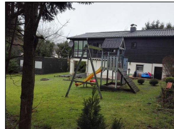
Abb. 4: Strukturarmer Hausgarten mit teils vermoosten Vielschnitttrassen.