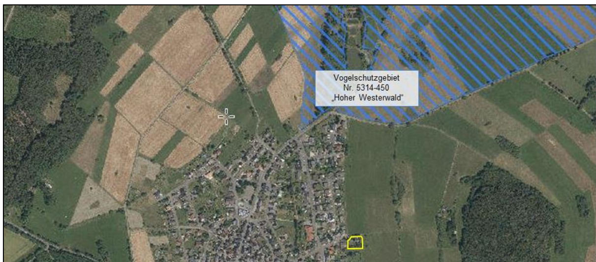
Abb. 9: Lage des Plangebietes (gelb umrandet) zum Vogelschutzgebiet Nr. 5314-450 „Hoher Westerwald“ (Quelle: NaturegViewer, Zugriffsdatum: 10.01.18, eigene Bearbeitung).

Etwa 350 m nördlich vom Plangebiet, liegt das nächstgelegene 7604,76 ha große Vogelschutzgebiet Nr. 5314-450 „Hoher Westerwald“ ( Abb. 9 ). Das Schutzgebiet ist ein wichtiges und artenreiches Brut- und Rastgebiet für Vogelarten des Offenlandes, der Wälder und Gewässer. Es stellt das einzige Brutgebiet für den ehemals in Hessen ausgestorbenen Fischadler dar und ist gleichzeitig eines der fünf besten hessischen Brutgebiete für Haselhuhn, Wachtelkönig, Krickente, Braunkehlchen, Wiesenpieper, Raubwürger sowie ein TOP 5 -Gebiet für Schwarzmilan, Wespenbussard, Raufußkauz, Grauspecht, Wendehals, Heidelerche, Neuntöter, Schwarzkehlchen und Tannenhäher im Naturraum Westerwald. Weiterhin ist es ein wichtiges Rastgebiete für den Fischadler und die Ringdrossel in Hessen und zusammen mit dem rheinlandpfälzischen Teil der Krombachtalsperre für Wasservögel und Limikolen.