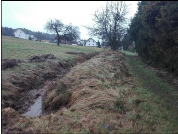
Abb. 7: Östlich vom Plangebiet verlaufender Grasweg mit Entwässerungsmulde und Obstgehölzen (außerhalb des Plangebiets).