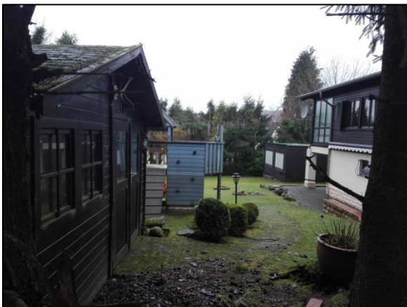
Abb. 3: Südöstliches Gartenhaus und Kinderspielanlage.