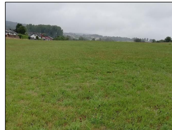
Abb. 6: Die Umgebung des Plangebiets. Blick in den Norden (außerhalb des Plangebiets).