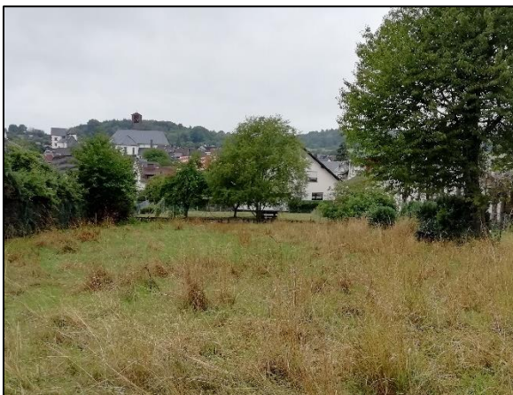
Abb. 5: Die Mähwiese südlich des Plangebiets. Blick von Osten nach Westen (außerhalb des Plangebiets).