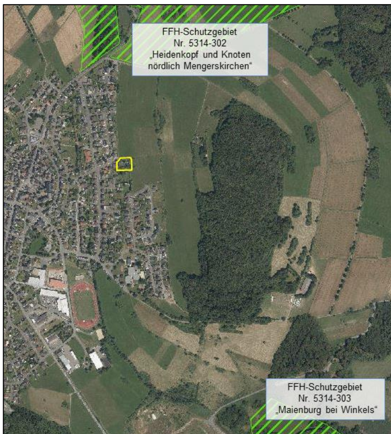
Abb. 10: Lage des Plangebietes (gelb umrandet) zum FFH-Schutzgebiet Nr. 5314-303 „Maienburg bei Winkels“ und zum FFH-Schutzgebiet Nr. 5314-302 „Heidenkopf und Knoten nördlich Mengerskirchen“ (Quelle: NaturegViewer, Zugriffsdatum: 10.01.18, eigene Bearbeitung).

Das Flora-Fauna-Habitat-Schutzgebiet Nr. 5314-303 „Maienburg bei Winkels“ ist insgesamt 12 ha groß und etwa 1,2 km südwestlich vom Plangebiet entfernt. Es umfasst einen markanten, naturnahen Waldmeister-Buchenwald, der am Südosthang von einem Ahorn-Linden-Blockschuttwald umgeben wird ( Abb. 10 ).