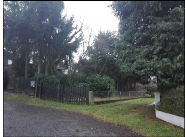
Abb. 8: Südlich anschließender Grasweg sowie Schotterfläche (außerhalb des Plangebiets).