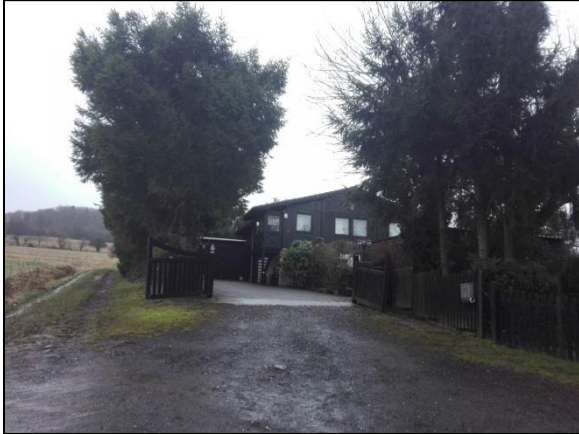
Abb. 1: Nordwestliche Hofeinfahrt mit Garage und Wohnhaus sowie Fichteneinfriedung.

Insgesamt schließt westlich und südlich an das Plangebiet der Siedlungsbereich von Mengerskirchen an.